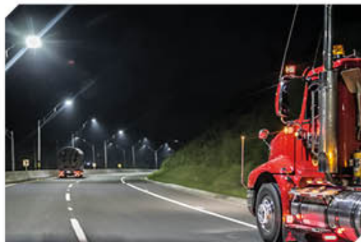
Fotografía autopista Medellín - Bogotá. Devimed

"Presentamos alternativas para construir 70 km. nuevos desde el sector Alto Bonito, lo que permite pasar más cerca de las cabeceras de Granada y Cocorná y nos apartamos de zonas inestables como La Leticia y Aragonés, donde hacemos un trazado diferente, es decir, mejoramos las condiciones para estabilidad de la obra, evitando sitios vulnerables de