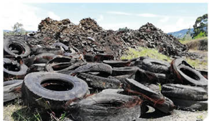
Llantas y otros materiales altamente contaminantes se encuentran a cielo abierto sin que a la fecha se observe una intervención en el sitio que denote solución.