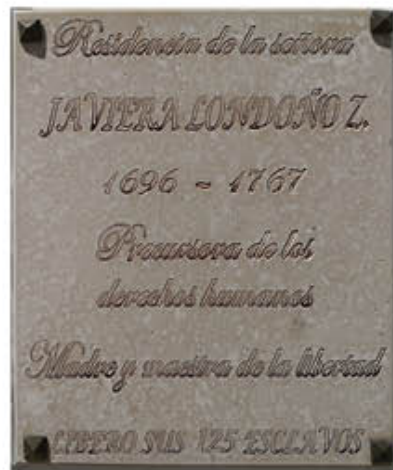
Placa conmemorativa ubicada en la fachada del sitio donde antes se levantaba la casa de Javiera Londoño. Costado norte del parque principal de Rionegro (Antioquia). Foto: Felipe Osorio Vergara (2019).

Javiera Londoño desempeñó el primer gesto libertario y defensor de la igualdad y la fraternidad en América. Ella merece figurar en todas las páginas de la historia como una pionera del movimiento antiesclavista en Colombia y América, pues fue capaz de ver en sus esclavos y esclavas a personas como ella en un momento en que se creía que ser negro o negra encarnaba el mal. Su valentía y temple para sobreponerse a los hombres que buscaban opacarla y someterla a sus intereses es mucho más valioso si se considera el período histórico en el que esta heroína existió, en el furor de la sociedad colonial, que era católica y patriarcal a ultranza. Narrar la vida de doña Javiera desde la tribuna periodística es un deber moral que se tiene con la historia y una forma de hacerle justicia a esta mujer que, consciente o no, trascendió como una precursora de los derechos humanos 22 años antes de la Revolución Francesa y en tiempos en los que ni siquiera se habían redactado los Derechos del Hombre y del Ciudadano. Doña Javiera Londoño, una criolla con espíritu afro.