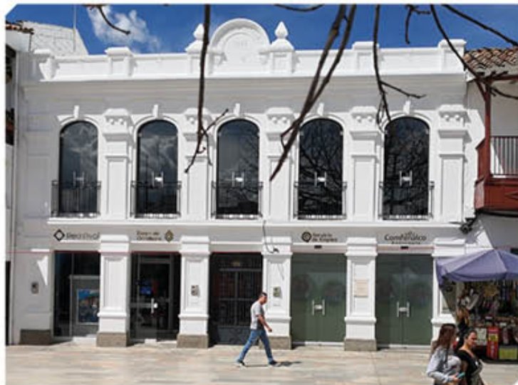
El edificio blanco corresponde al emplazamiento original en donde en el siglo XVIII se alzaba la casona del matrimonio Castañeda Londoño. Rionegro (Antioquia). Foto: Felipe Osorio Vergara (2019).

Casi medio siglo antes de que se dieran los primeros pasos para la abolición de la esclavitud en Antioquia, y precediendo en 150 años la Declaración Universal de los Derechos Humanos, doña Javiera Londoño protagonizó la primera liberación masiva de esclavos y esclavas en Colombia y, quizá, en todo el hemisferio occidental. Ella es también símbolo de determinación femenina en un período de fuerte dominio patriarcal y eclesiástico.