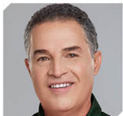
Anibal Gaviria - Gobernador de Antioquia