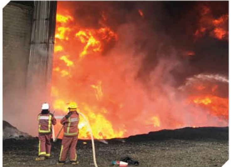
La empresa Mundo Limpio cuando fue consumida por las llamas en septiembre en 2018

"Esta empresa solicitó una licencia para la construcción de una bodega nueva en otro sitio diferente a donde se encuentra ubicado. Ellos estaban