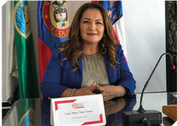
rionegrera; pero ahora que no voy a estar en la corporación seguiré pendiente desde los escenarios donde me encuentre".