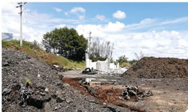
Las ruinas de lo que fue la empresa Mundo Limpio aún dan cuenta del responsable de la contaminación actual.

Finalmente, este proceso se encuentra aún pendiente de una respuesta por parte de los encargados de Mundo Limpio, quienes según Cornare, no han cumplido con lo requerido y a la fecha el abandono del sitio es notable y sin responsable por la afectación al medio ambiente.