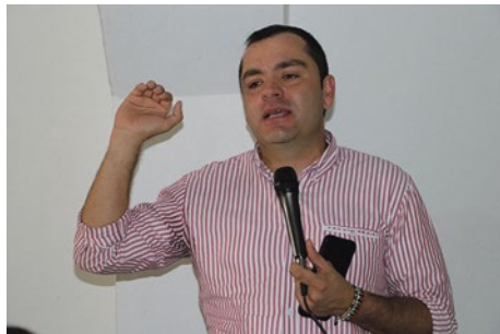
Saúl Giraldo Gómez, Alcalde municipal – Foto: Alcaldía

Para los últimos meses de la administración, el alcalde de Cocorná, Saúl Giraldo Gómez, informó que este año tuvo la posibilidad de concretar, tanto con el gobierno nacional como con el departamental, algunos proyectos que estaban en trámite, de manera que estos meses van a ser un período de énfasis en la ejecución.