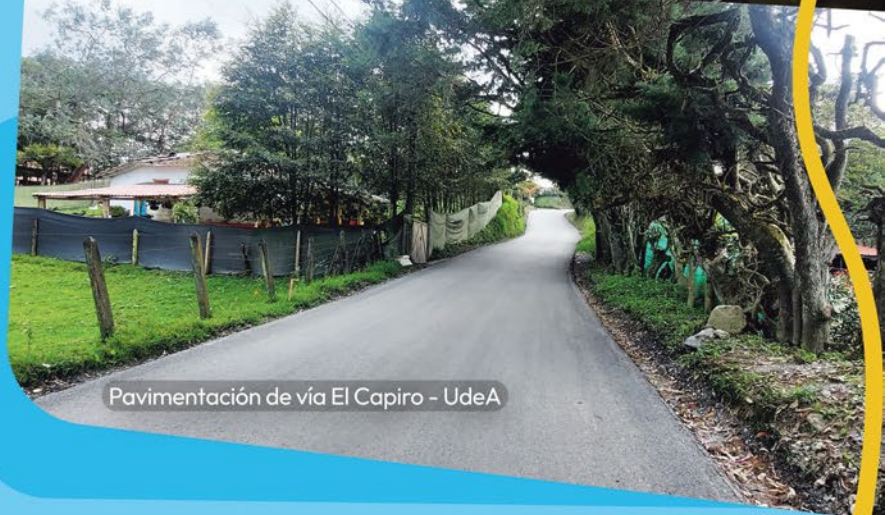
Pavimentación de vía El Capiro - UdeA