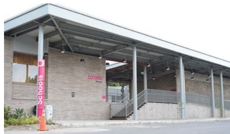
Nueva sede de Cosmo

El proyecto hace parte del plan de expansión de la Caja de Compensación familiar en el Oriente antioqueño con lo que ha denominado centros de experiencias. También se anunció para 2024 una nueva sede en Llanogrande, ubicado en las instalaciones de la Universidad EAFIT.