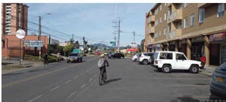
Vía urbana San Antonio – La Ceja