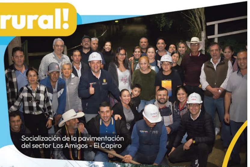
Socialización de la pavimentación del sector Los Amigos - El Capiro

mejoramos la movilidad y la calidad de vida de nuestra gente.