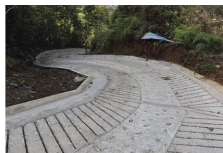
Las placa huella han permitido mejorar las vías en zonas rurales

Anunció también el alcalde, que con la Gobernación de Antioquia están terminando de ejecutar más de 4.500 millones de pesos en un proyecto que para Cocorná es estratégico, como es la pavimentación de una vía terciaria