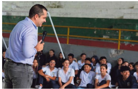
Escuela Urbana Felipe Santiago

También se invirtieron recursos en conexión a internet para las sedes educativas rurales; dotación de instrumentos musicales; proyectos productivos y agropecuarios, para el mejoramiento de la seguridad alimentaria.