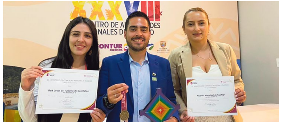
La distinción incluyó además de Guatapé al municipio de San Rafael

Por la gestión y el trabajo en equipo, el municipio de Guatapé recibió un nuevo reconocimiento esta vez por parte del Ministerio de Industria, Comercio y Turismo, en Innovación y Transformación Digital, distinción que fue entregada en el marco del XXVIII Encuentro Regional de Autoridades de Turismo que se llevó a cabo en Santiago de Cali, donde se reconoció el trabajo que hacen las entidades territoriales, gremios, academia, prestadores de servicios turísticos y comunidades vinculadas al sector turismo.