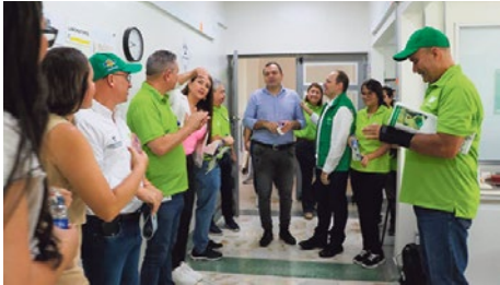
Hospital San Juan de Dios – Foto: Alcaldía de Cocorná

La Administración departamental está ejecutando inversiones por 23.565 millones de pesos en los municipios de Cocorná y San Francisco, para la construcción de obras relevantes que han tenido un impacto positivo en la calidad de vida de los habitantes de estas localidades del Oriente antioqueño.