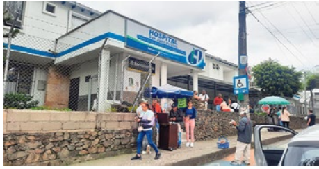
El centro asistencial de la región se mantiene a flote a pesar de las deudas de las EPS.