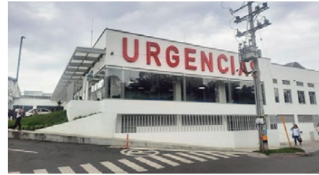
Nueva central de Urgencias en Rionegro

Quiceno considera que eso tiene sus más y sus menos. “Es ventajoso para los Hospitales que los recursos no hagan tránsito por las EPS,s, pero también hay que ser claros, hay hospitales mal manejados, con mucha corrupción, con mucho despilfarro y también serían un saco roto frente a los Hospitales que son eficientes y por lo tanto tiene que haber una buena vigilancia desde el punto de vista de la facturación, para que algunos no vayan a facturar el doble de lo que facturaban, muchas veces con cuentas ficticias, como lo ocurrido en un hospital de la Costa que facturaba por atención a hemofílicos, cuando no existían hemofílicos y facturaban miles de millones de pesos. Es muy riesgoso y hay que saber manejar esos dineros porque no se pueden entregar a la topa tolontra”, sostiene el gerente del San Juan de Dios de Rionegro.