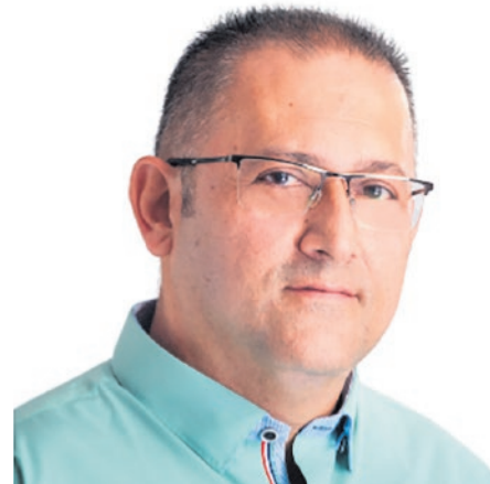
Alex Arias, alcalde electo de San Francisco

surgimiento de un hospital de primer nivel que brinde los servicios con que no se cuenta en la zona Bosques, como pediatría. También es se hizo énfasis en la necesidad de mejorar la autopista Medellín-Bogotá, que es la principal ruta de acceso para estas localidades, y que ahora está llena de huecos, ocasionando accidentes diariamente, "la idea es avanzar en una doble calzada y construcción de muros de contención en las partes de fallas geológicas", dice Alex Arias mandatario electo de San Francisco. "Lo que se prometió aquí fue gestionar. Así que no somos negativos ante el gobierno nacional, porque lo fundamental es seguir trabajando de la mano de nuestros senadores y demás líderes políticos para conseguir recursos para ejecutar los proyectos", -agregó- quien también mencionó que este tipo de encuentros regionales son importantes porque son fundamentales para mejorar la calidad de vida de sus pobladores.