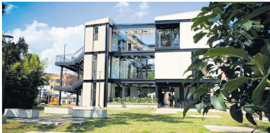
Cubo de la innovación