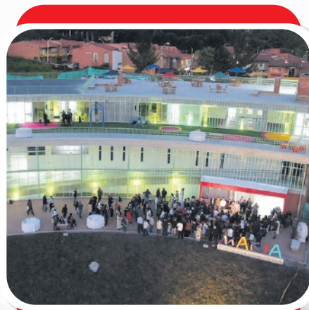
Centro Integral de Atención Diferencial, MAKIA

Llega el fin de año, y con este, el momento de hacer un balance de los logros obtenidos y de los aprendizajes que deja el haber trabajado de la mano de un gobierno que se caracterizó por convertir a Rionegro en una ciudad proyectada a futuro.