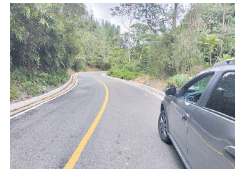
Vía pavimentada

Mauricio Giraldo , Granadino, Senador de la República - "Después de muchos años, anhelos, y esfuerzos de muchas personas, se consiguió unir estos municipios. Ahora el reto está en proteger este corredor e impulsar que por él ingrese cada vez más prosperidad para los habitantes."