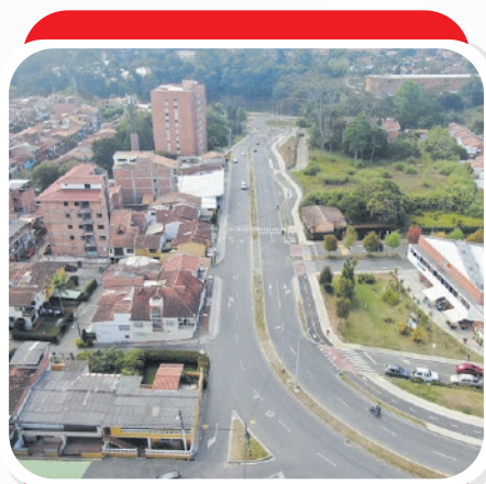
Doble calzada Casamía – Pietra Santa – Libertadores