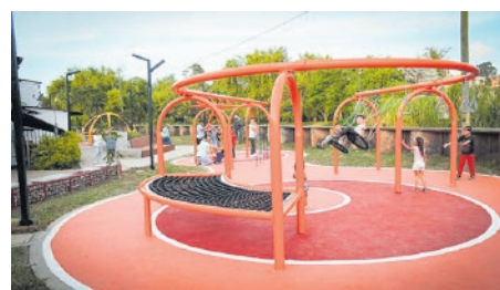
Parque infantil, malecón Las Playas

lineal por el río enfocado en la adaptación al cambio climático y espacios peatonales para un recorrido al aire libre”, explicó la administración.