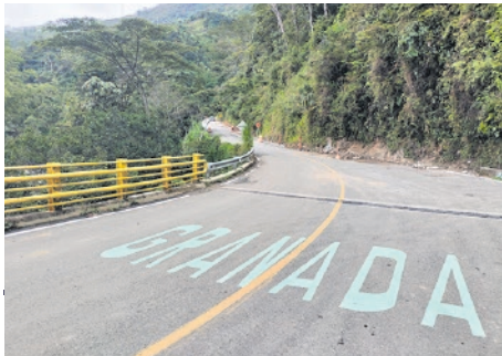
Puente Calderas, límite de ambos municipios