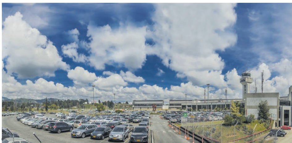
Aeropuerto JMC