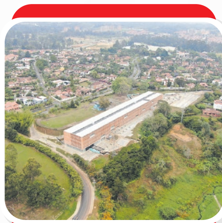
Nuevo Colegio San Antonio, sector Gualanday