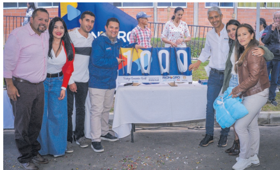
Evento de entrega