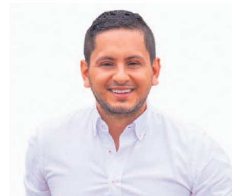
Esteban Quintero Cardona, Senador de la República

dijo que “lo mejor para reducir la accidentalidad no son los resaltos, aunque estos funcionan, sino otras alternativas, como la creación de intercambiadores viales y separación física de carriles, ya hicimos una prueba entre la glorieta del aeropuerto y donde será la fábrica de vacunas, donde se redujo la tasa de mortalidad a 0 y los heridos en un 70% con relación al mismo período del año anterior, y la movilidad no se ha visto perjudicada por estas medidas”.