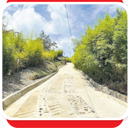
Nuevas placa huellas para el sector rural