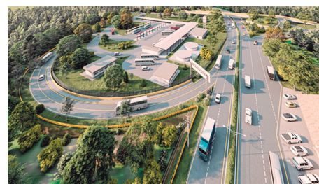
Terminal de transporte, ubicada en el sector Belén sobre la Autopista.

Según indicó, este equipamiento permitirá organizar una parte importante del transporte intermunicipal que actualmente llega al centro de Rionegro y atender rutas provenientes de municipios del Oriente antioqueño.