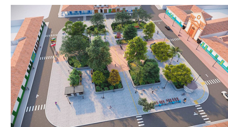
Parque San Antonio, renovará su aspecto y ampliará espacios de encuentro ciudadano.

Más de 600 convites comunitarios han movilizado a 10.000 ciudadanos en Rionegro: Andrés Aristizábal