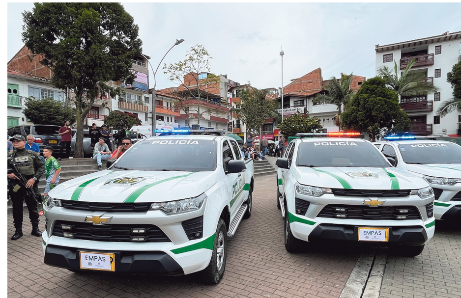
$73.181 millones se destinan en 2026 para los Escuadrones Militares y de Policía Antioquia Segura (EMPAS), entrega en El Santuario.

También avanzan estudios y diseños para la construcción de la guardia