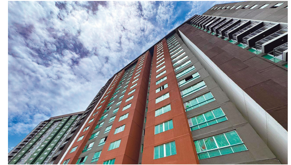
Viviendas de interés social y prioritario entregadas por Viva

En el caso de Rionegro, recordó la reciente entrega de subsidios a 98 familias del proyecto Cerros de la Fortuna, recursos destinados a facilitar el cierre financiero de los hogares beneficiarios. Además, informó que actualmente se ejecutan 230 mejoramientos de vivienda en el