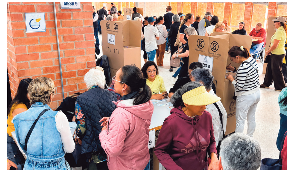
La ruralidad dispersa influye en los porcentajes de votación