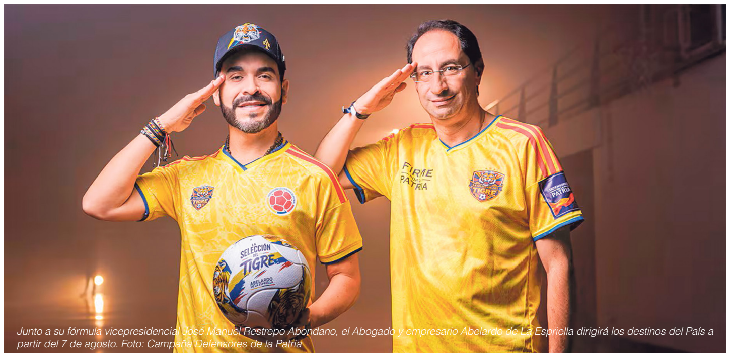
Junto a su fórmula vicepresidencial José Manuel Restrepo Abondano, el Abogado y empresario Abelardo de La Espriella dirigirá los destinos del País a partir del 7 de agosto.