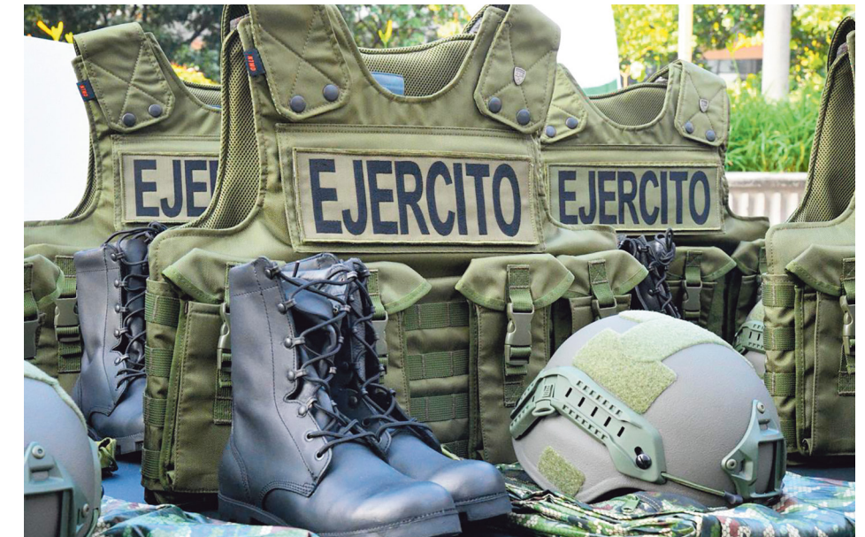
Con la Tasa de Seguridad, la Gobernación de Antioquia entregó chalecos, radios, cascos, botas, entre otros, al ejército nacional.

En Rionegro se adelantan proyectos para la construcción de una unidad deportiva rural y una cancha sintética en la vereda Cimarronas. En El Retiro se ejecutan obras en la Unidad Deportiva Riberas y el