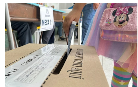
Las consultas populares históricamente registran menores niveles de participación - Fotografía: cortesía

En conclusión, si algo parecen demostrar las cifras de las últimas décadas es que más que una participación ocasional, el Oriente Antioqueño parece haber construido una verdadera cultura democrática, donde acudir a las urnas hace parte de la identidad de buena parte de sus habitantes.