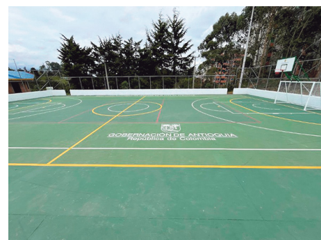
Placa Polideportiva Rionegro

La información suministrada a La Prensa Oriente por la Secretaría de seguridad, precisa que entre el 1 de enero de 2025 y el 27 de mayo de 2026, el recaudo de la Tasa de Seguridad alcanzó los $245.015 millones de pesos. De ese total, los contribuyentes del Oriente antioqueño aportaron $26.151 millones de pesos, de los cuales $17.009 corresponden a 2025 y $9.142 a 2026.