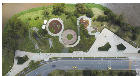
Paisajes de agua, 72.000 metros cuadrados de espacio público.

El secretario explicó que este modelo también se ha utilizado para desarrollar infraestructura vial rural. Durante el año anterior se ejecutaron más de 26 placa huellas bajo esta modalidad y para 2026 se proyectan cerca de 20 intervenciones adicionales.