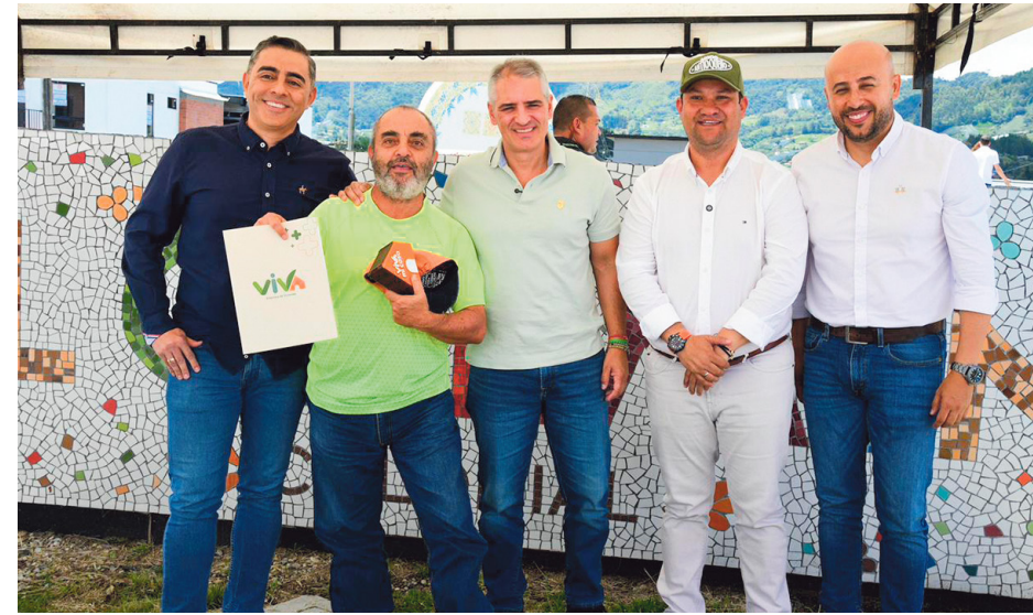
En compañía del Gobernador Andrés Julián Rendón y el alcalde Hugo Jiménez Cuervo, Viva entregó viviendas de interés social en el municipio de El Carmen de Viboral

De acuerdo con Hernández, 102 municipios presentaron terrenos, pero únicamente 30 cumplieron las