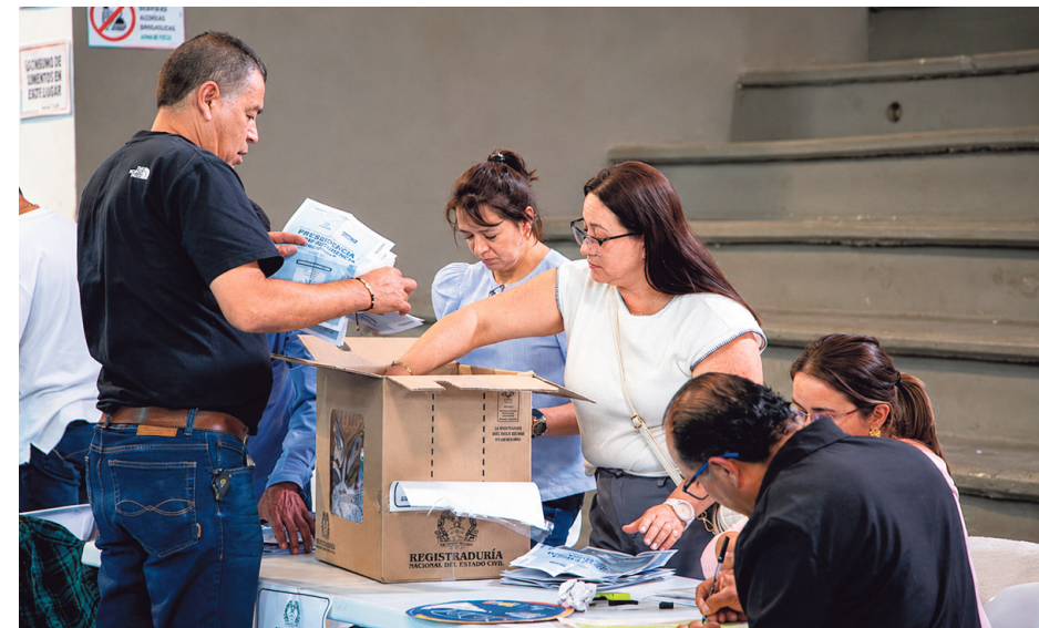
En El Retiro y La Ceja, cerca del 80% de ciudadanos que deciden en las urnas

Más allá de la cifra, los expertos coinciden en que detrás de esos resultados existe una construcción social de muchos años. "Antes eran los mayores quienes decían por quién se votaba, hoy son los jóvenes quienes llegan a sus hogares con información, contrastan propuestas y recomiendan opciones electorales. Las redes sociales también han cambiado profundamente esa dinámica", explica Alcides Tobón.