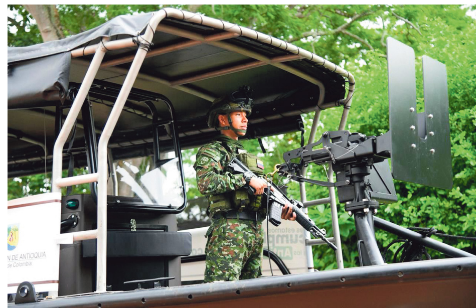
6 botes al Ejército Nacional en el Bajo Cauca, adquiridos con recursos de la Tasa de Seguridad.